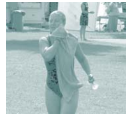
Kvindetri med mere end 50 deltagere