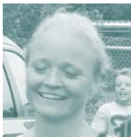
En glad pige på vej i mål ved Kvindetri 2006